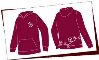
Pfadi Ha-Wi Pulli rot / braun als Leiterpulli