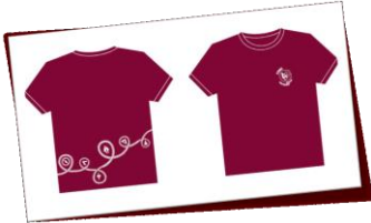
Pfadi Ha-Wi T-Shirt rot

Die Pfadikleider können online bestellt werden! Auf unserer Homepage könnt ihr die offiziellen Pfadikleider, sowie auch unsere abteilungsinternen Pullis, T-Shirts und Krawatten bestellen: